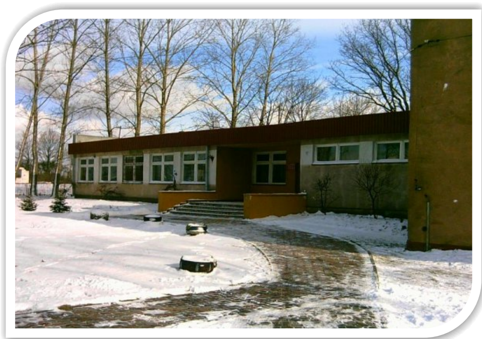
Budynek z roku 1987

22 lutego 1987 r. po raz kolejny została oddana do użytku nowa część budynku szkolnego. W nowej części znajdowały się toalety, sala dla przedszkolaków, pokój nauczycielski, gabinet dyrektora oraz szatnie.