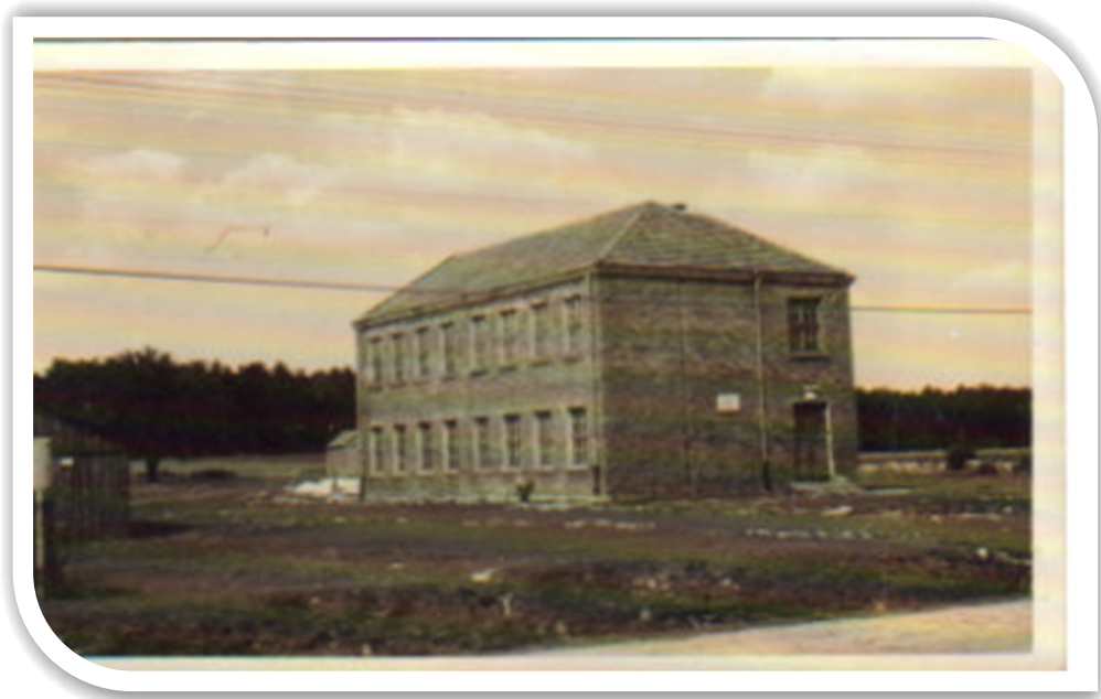
Budynek szkoły z roku 1937

W roku 1936 ukończono trwającą 5 lat budowę nowej szkoły. Był to jednopiętrowy budynek z czerwonej cegły, zaś w nim cztery sale lekcyjne.