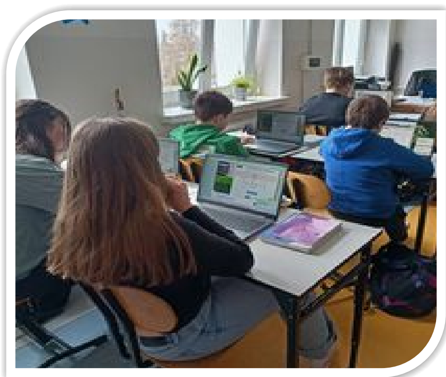
Uczniowie podczas zajęć lekcyjnych

Nasi najmłodsi uczniowie chętnie korzystają z rozbudowanego, nowego placu zabaw. Jednak szkoła to nie tylko budynek, ale osoby które dzięki swojemu zaangażowaniu tworzą naszą wspólną społeczność. Nasza kadra dba, by w codziennych aktywnościach uczniowie mieli czas na odpoczynek i kreatywność, dlatego chętnie biorą udział w wyjazdach na zielone i białe szkoty. Organizują wycieczki, letnie i zimowe półkolonie, a przede wszystkim dbają o wszechstronny rozwój naszych uczniów.