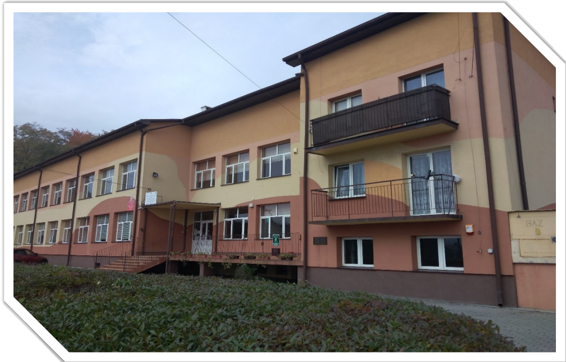
Budynek Szkoły Podstawowej w Słupczy