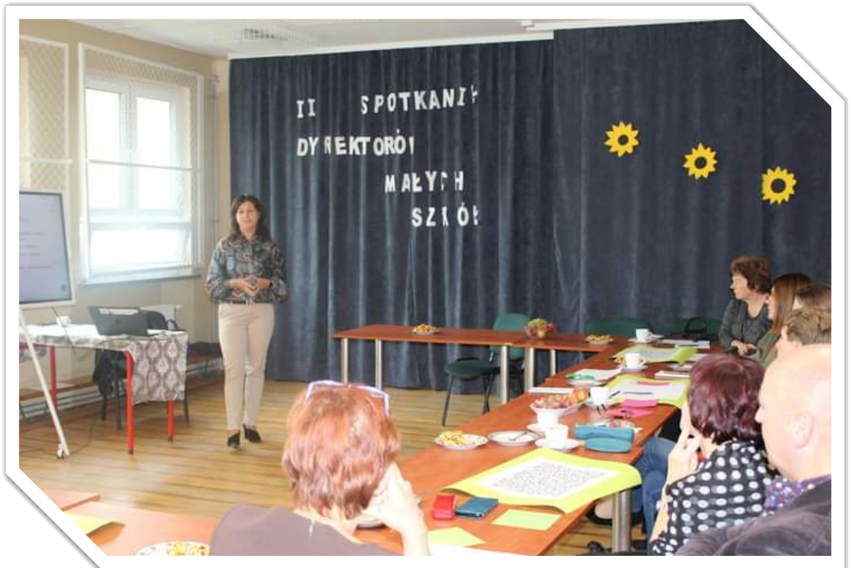
Uczestnicy spotkania w Publicznej Szkole Podstawowej w Szczecinie