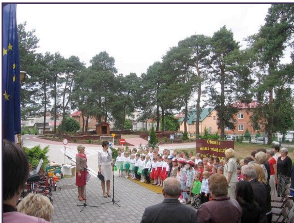
15.06.2009r. Uroczystość otwarcia "Mini-miasteczka ruchu drogowego". Nasze miasteczko, to jedyne tego rodzaju w powiecie sandomierskim