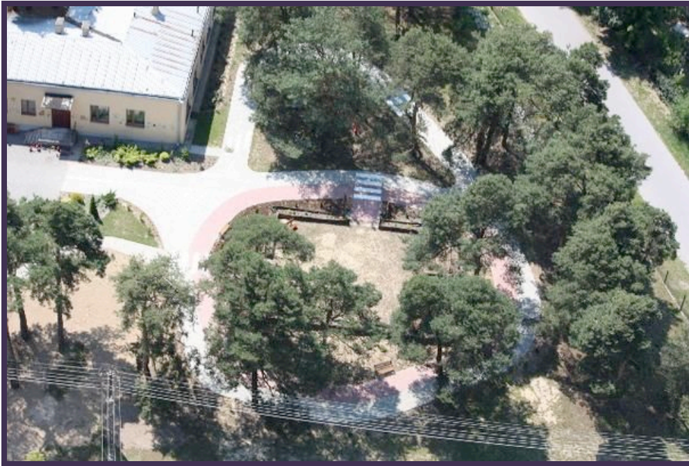
Nasze przedszkole, nasze sosny, nasze mini - miasteczko ruchu drogowego z lotu ptaka...