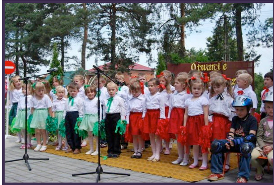
Zielone światło ruszaj, czerwone znaczy stop! Nasze przedszkolaki o tym wiedzą... i nie tylko o tym...