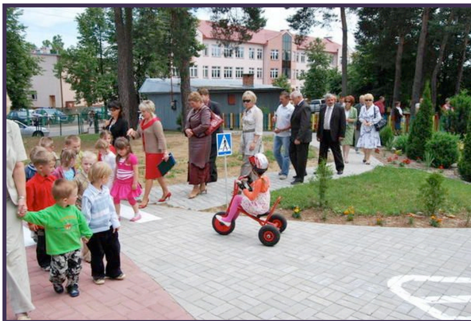
"Kiedy przechodzisz przez ulicę"...Pierwsza zabawa w "Miasteczku" - przedszkolaków i gości.